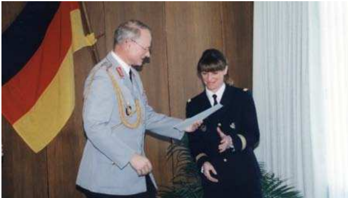
10 février - remise de la Ehrenkreuz der Bundeswehr in Silber par le Brigadier Général Hans Speidel