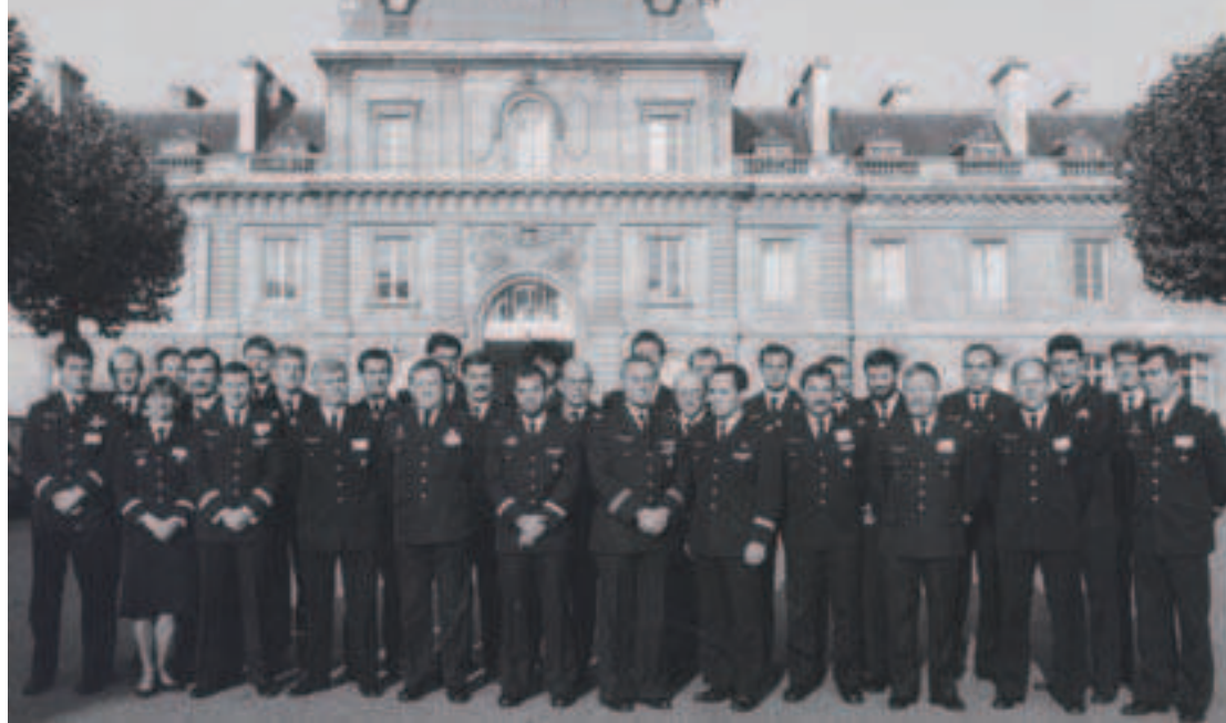
Séminaire - Ecole d'Etat-Major de l'Air - 04 -08 Novembre

Sinaï - Los Angeles - Mexico - Papeete - Pointe-à-Pitre