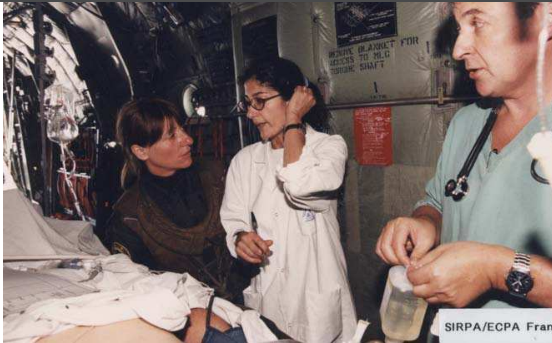
Evacuation de 3 blessés graves au départ de Sarajevo en C 130

Lieutenant-colonel au 1er janvier 1995 Ancône - Bangui - Cayenne - Dakar - N'Djamena