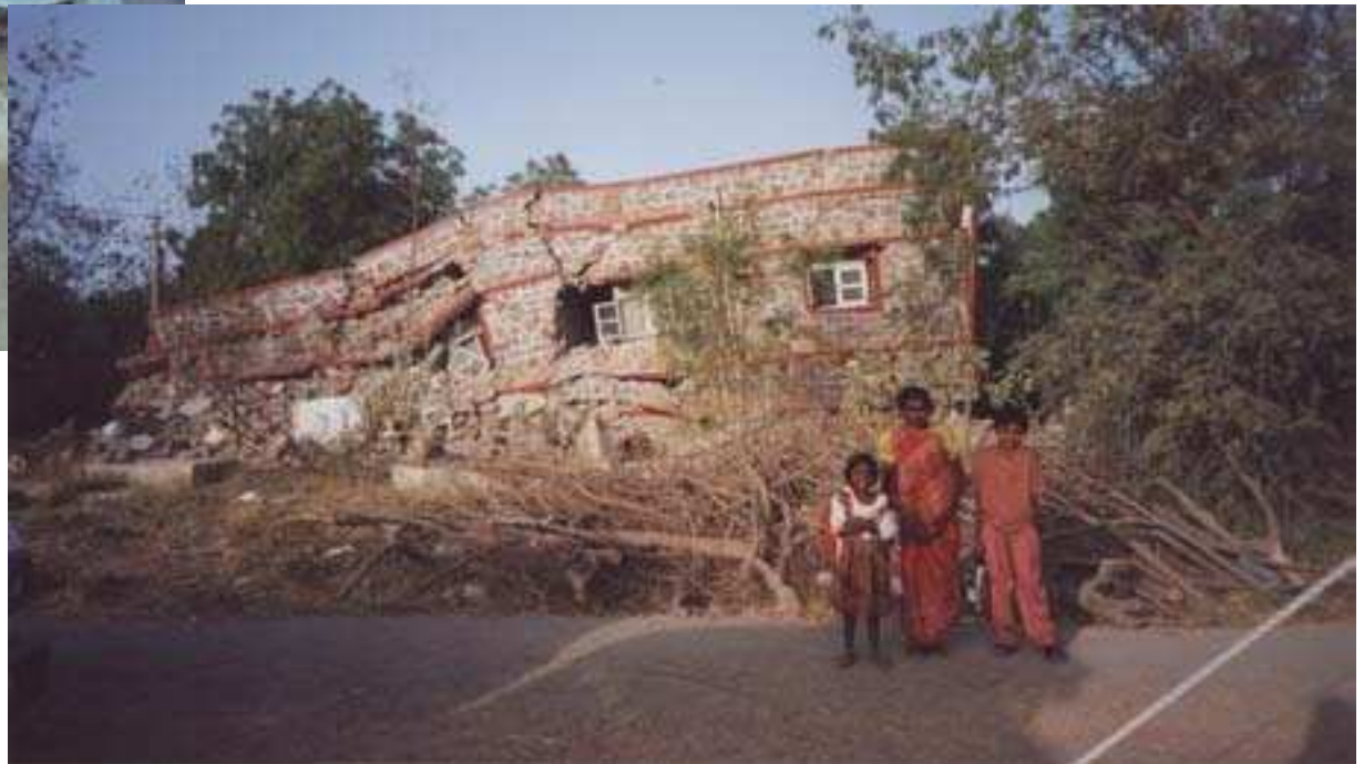
réfectoire des sœurs à Kuch