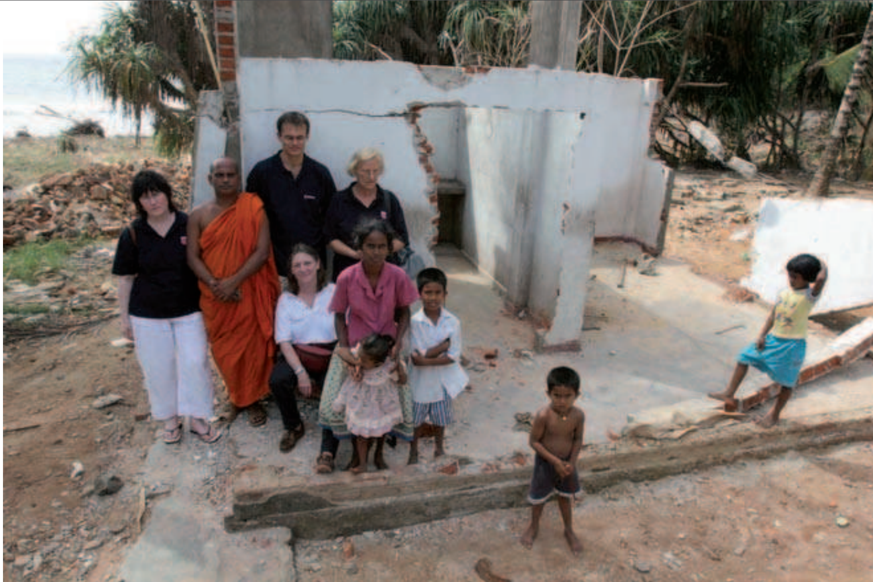
au Sri Lanka pour une mission de trois mois, après le Tsunami de décembre 2004