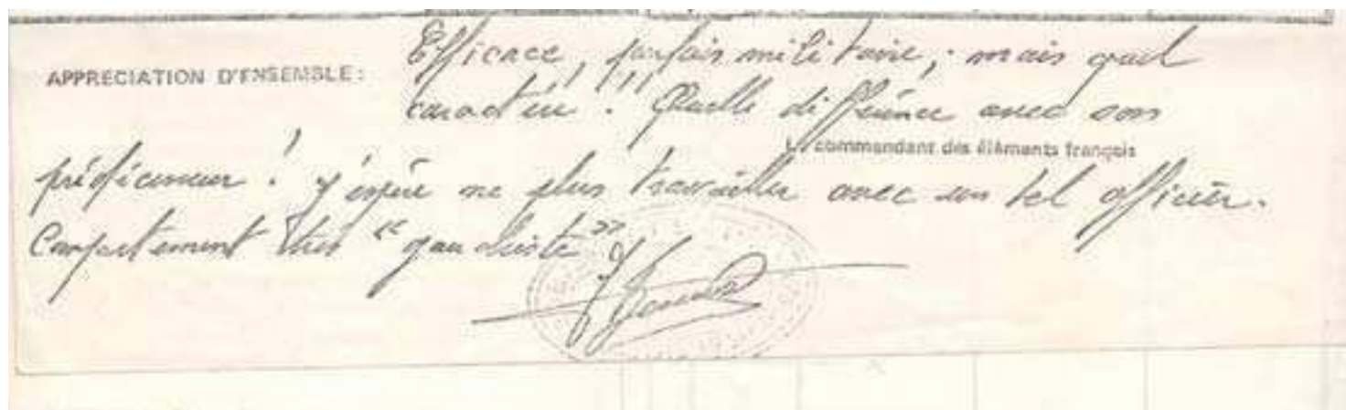
Fiche de notation (prometteuse !) en fin de mission au Sinai