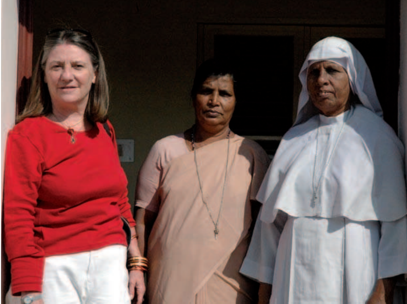
Au revoir aux religieuses du Sri Lanka - 7 février