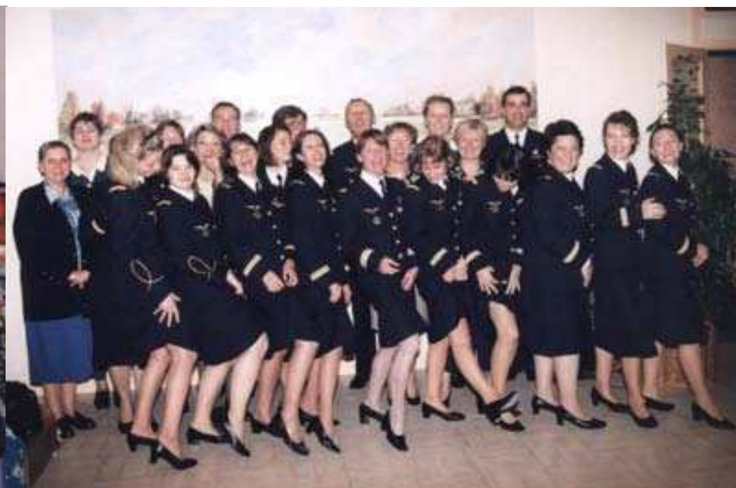
le corps de ballet des convoyeuses