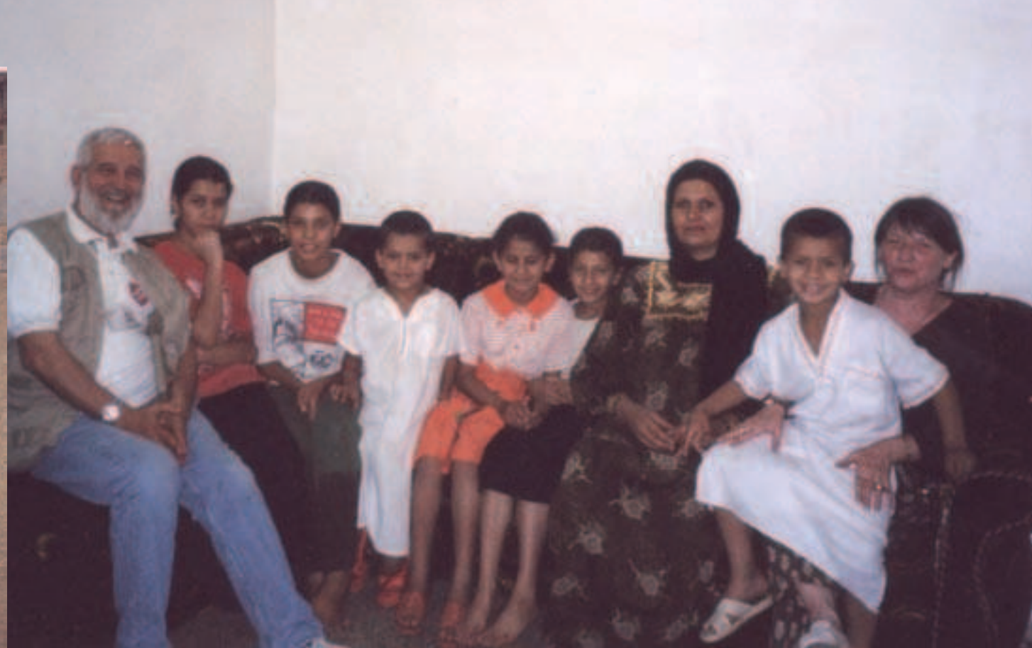
avec la famille de son chauffeur