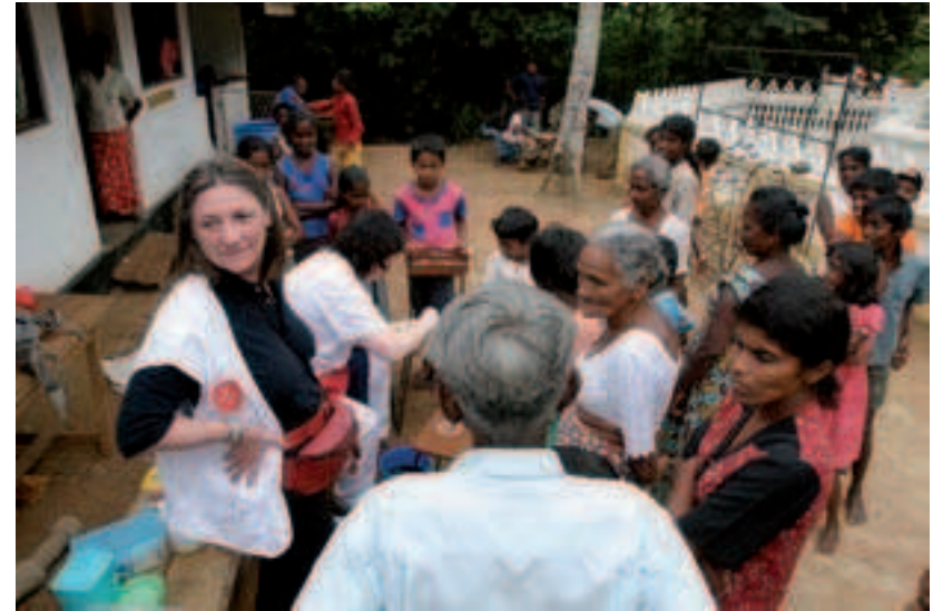
au centre de soins