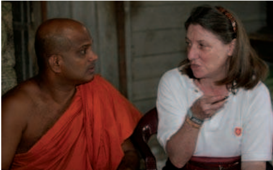
avec un abbé bouddhiste qui a été un des partenaires des projets de reconstruction à Habaraduwa (près de Galle) au Sri Lanka