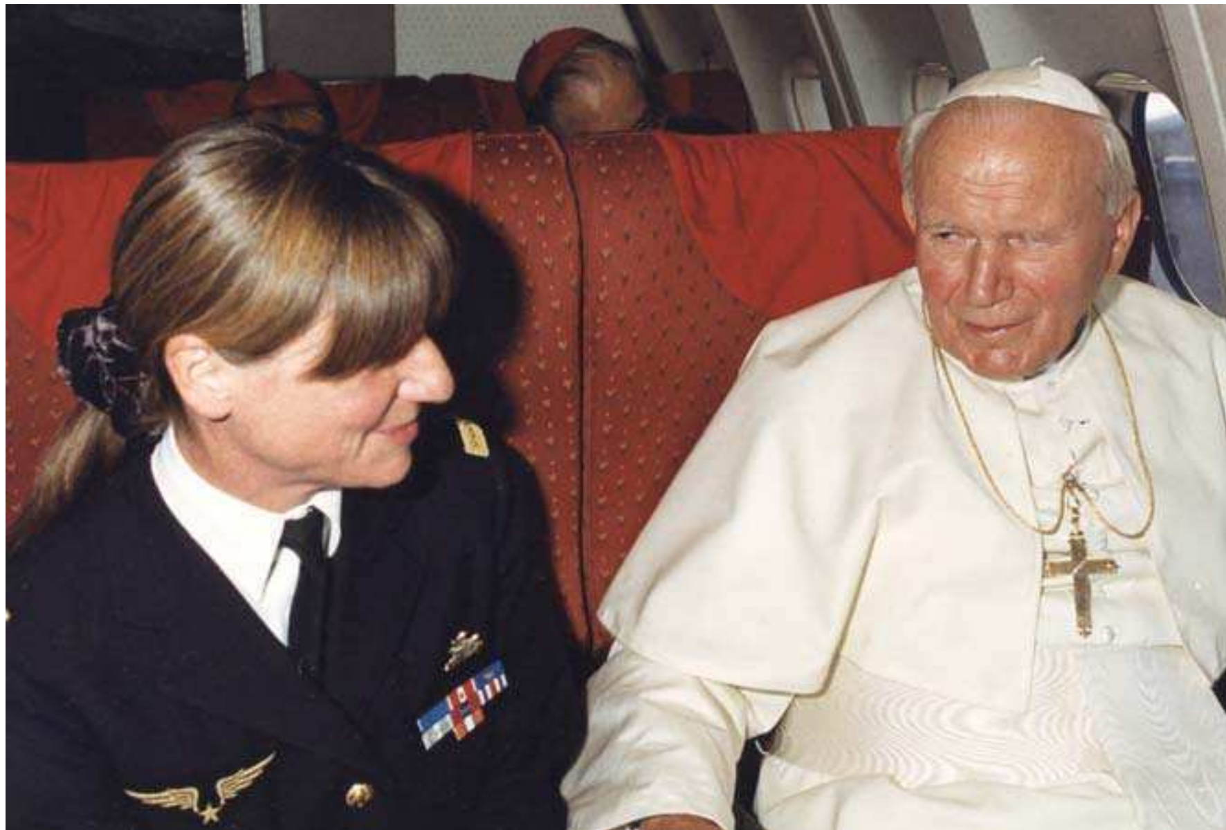
Avec le pape Jean-Paul II lors de sa visite en France