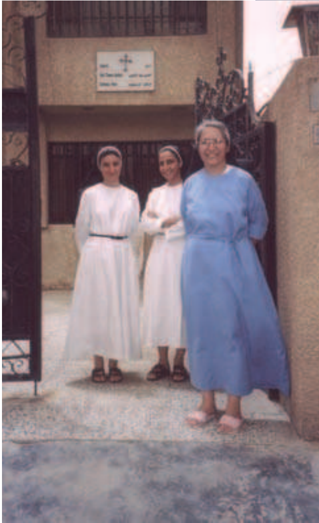
les sœurs dominicaines du couvent saint Thomas d'Aquin

Mission en Irak : création de deux petits dispensaires