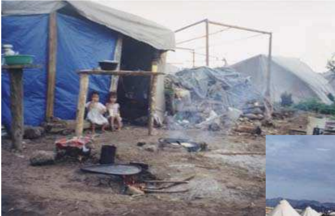
avant l'intervention de la mission