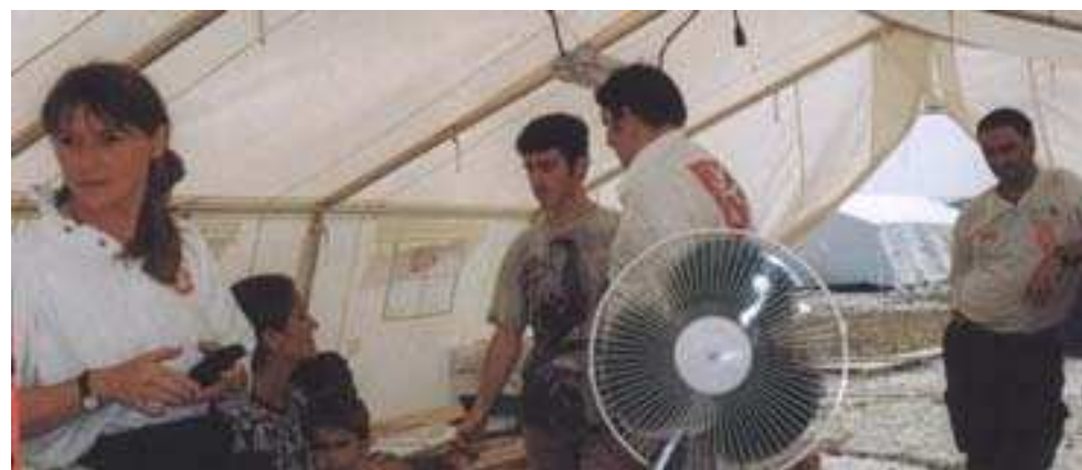
Chef de mission en Albanie : gestion d'un hôpital dans un camp de réfugiés