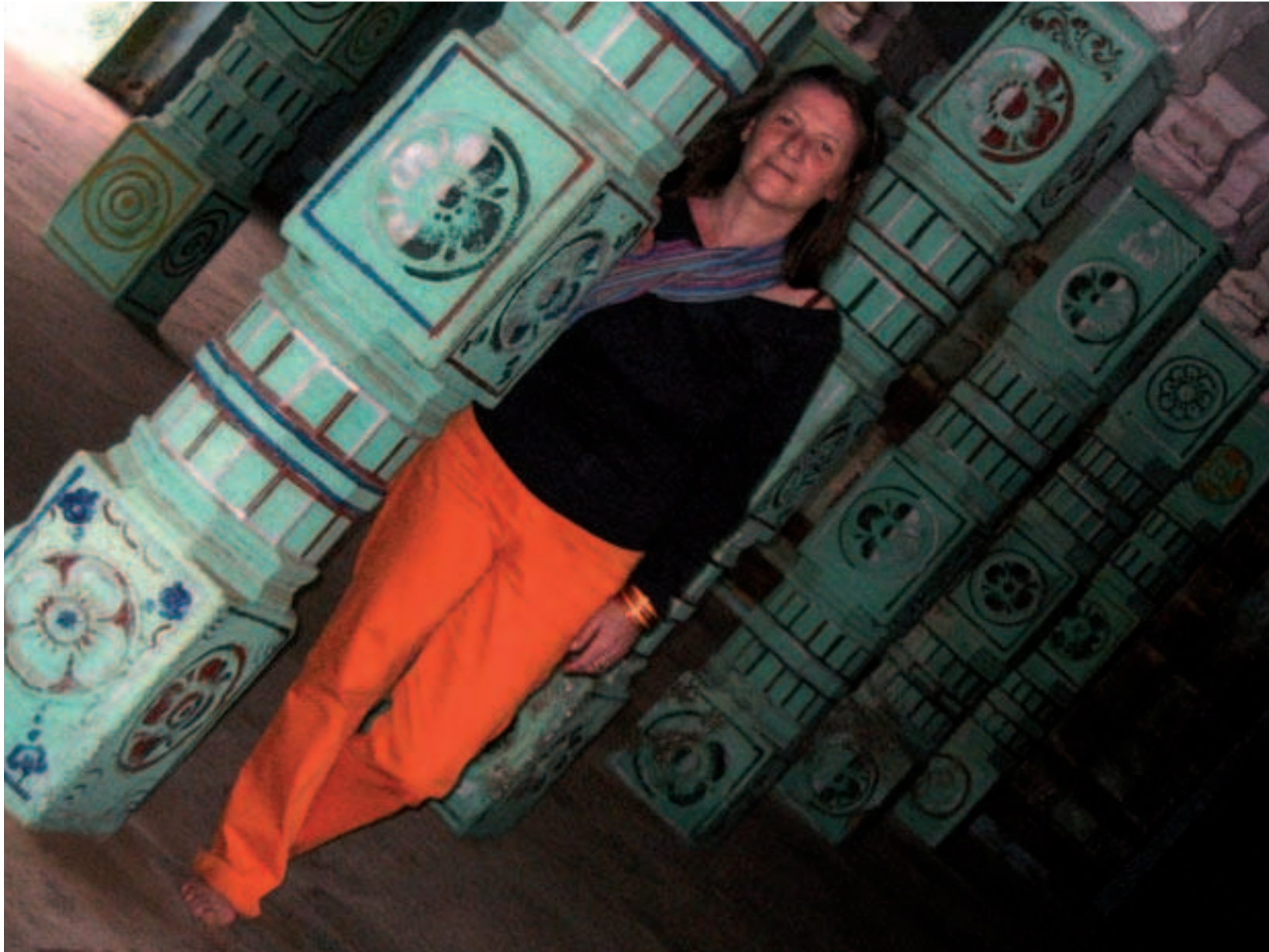
Dans un temple en Inde