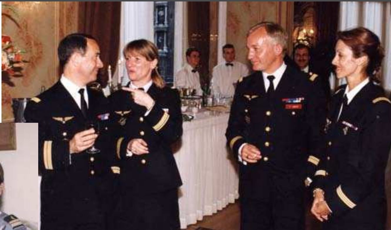
vœux à l'Elysée

Abidjan - Bangui - Djibouti - Libreville - Los Angeles - N'Djamena - Riad - Saint-Denis de la Réunion