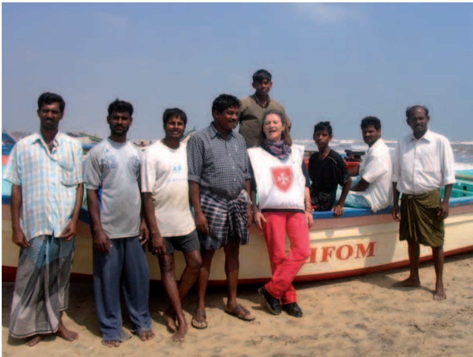
Mission accomplie les barques sont arrivées - 5 février au Sri Lanka