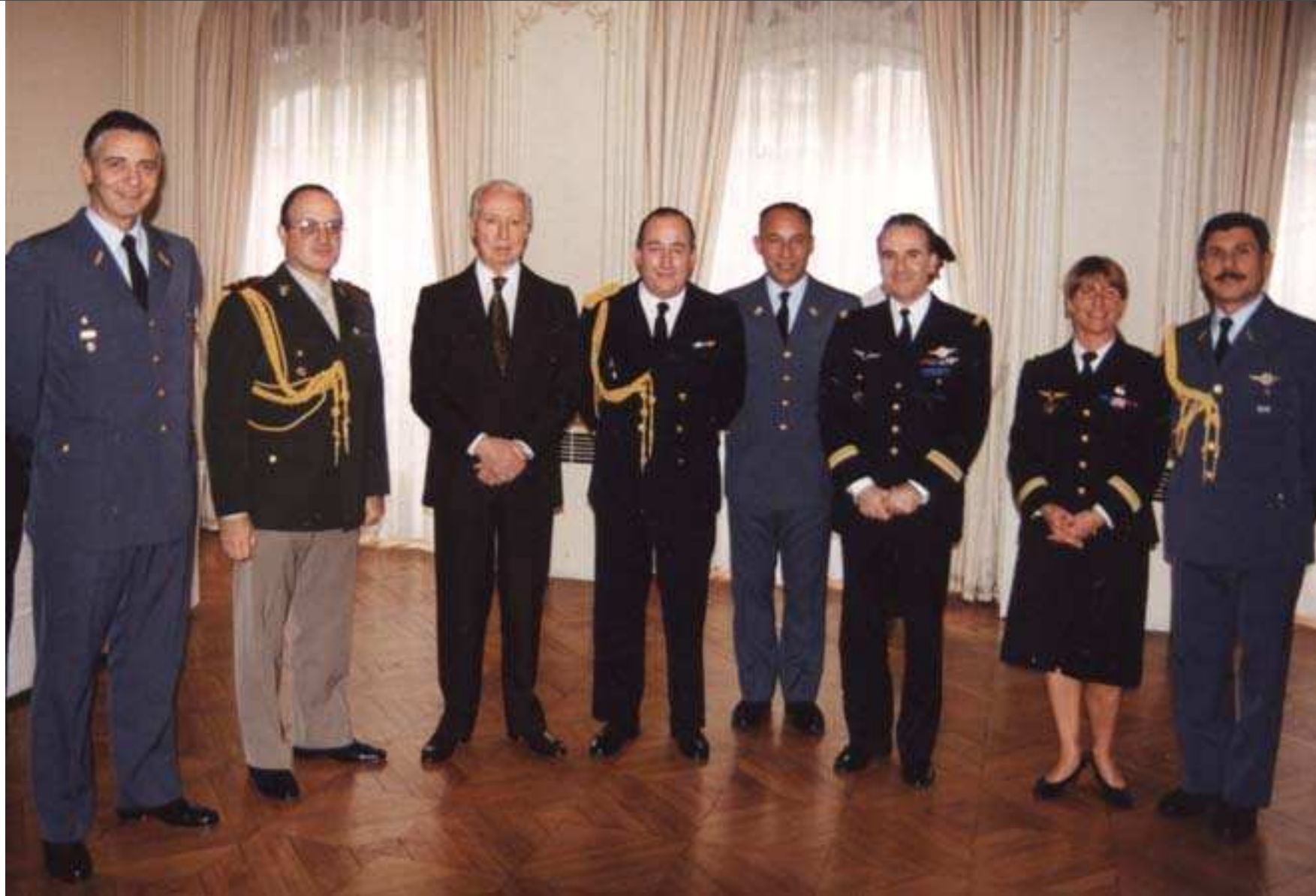
Remise de la Croix d'Honneur d'Argentine

A compter du 1 er septembre 1992 : chef de section attachés-visites