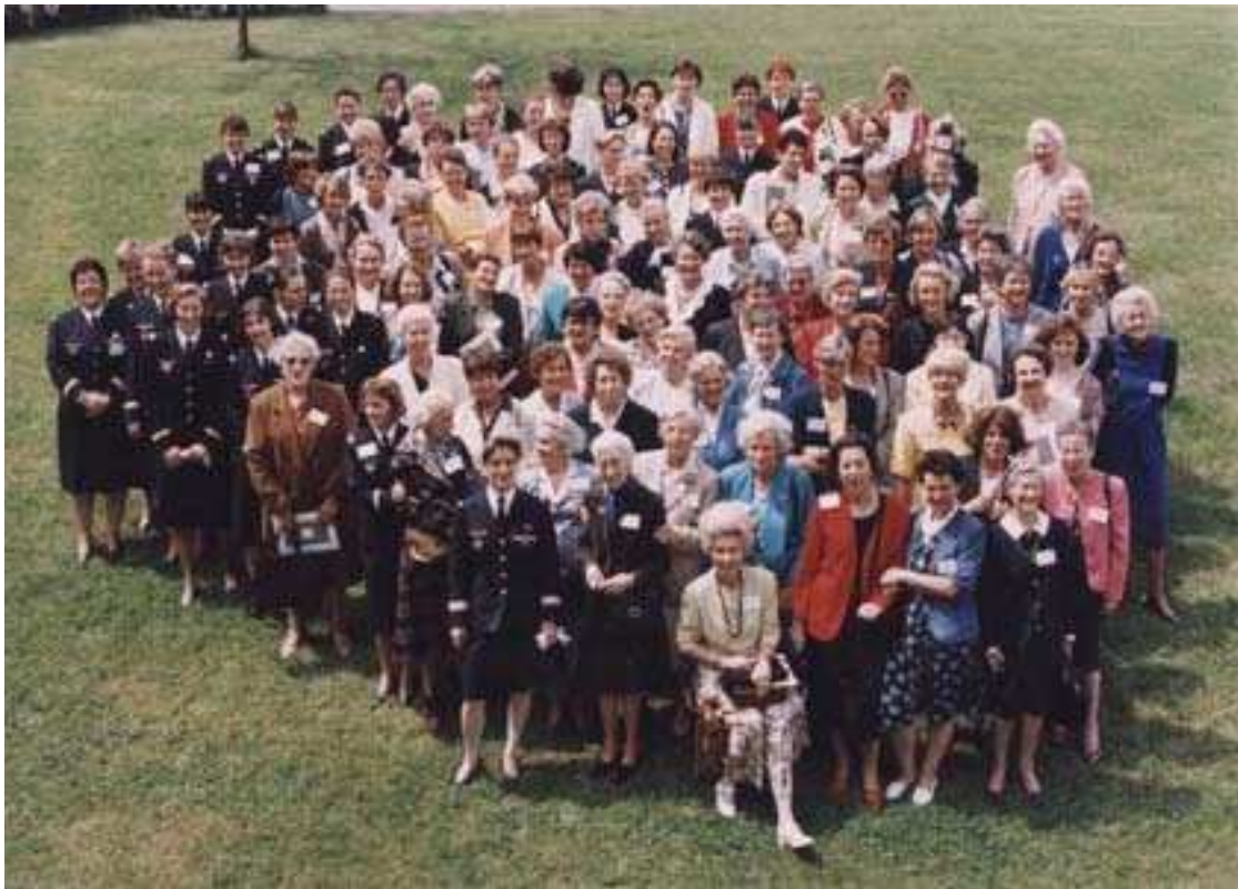
La famille des convoyeuses au complet