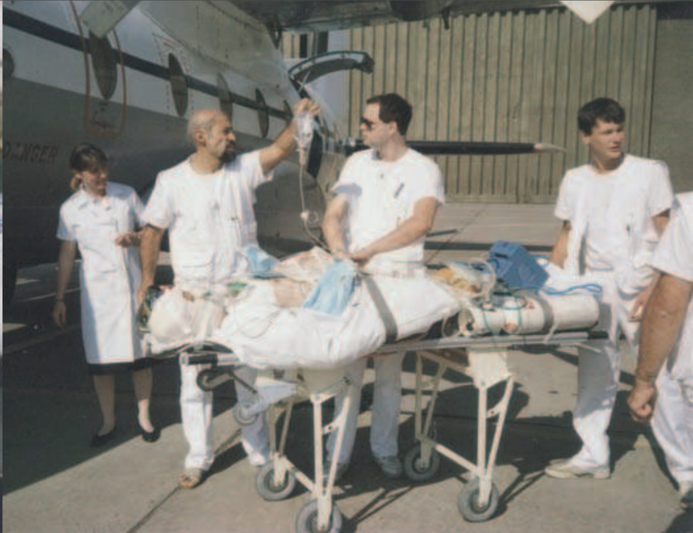
évacuation sanitaire grands brûlés par NORD 262