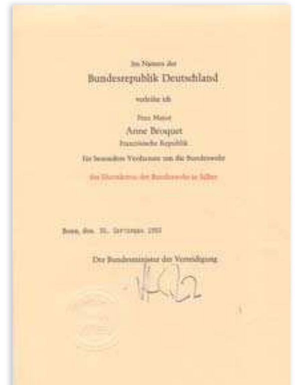
diplôme de la médaille d'argent de la Bundeswehr