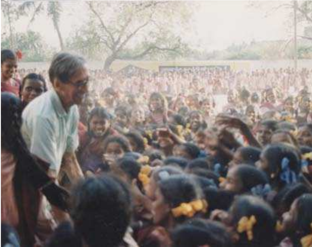
le père et les petites filles aux rubans bleus à Chidambaram

extrait de la lettre du père Ceyrac en date du 15 mai 2001