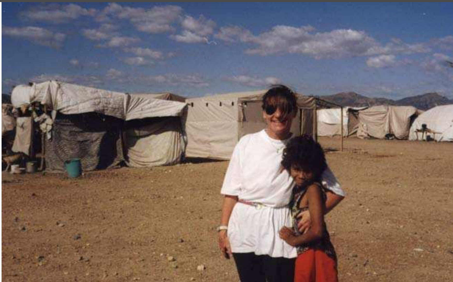
Au Honduras à Choluteca suite au cyclone Mich. Coordinatrice d'une mission d'urgence pendant six mois.