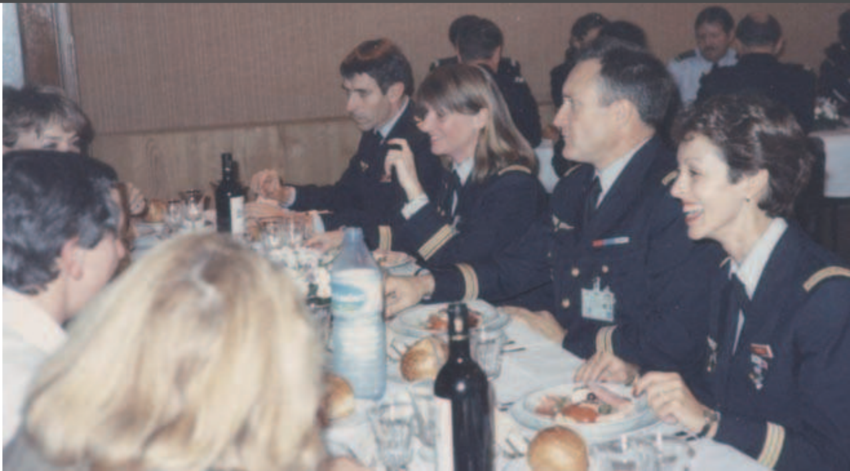
Départ pour rejoindre l'Etat Major à Balard

A compter du 14 novembre 1990 : sous Chef à la division des Relations Internationales Bangui - Djibouti - N'Djamena - Los Angeles